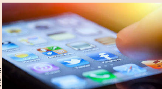
Las 'apps' también se utilizan para la gestión interna de los bufetes.

Desarrollada desde eLab de Ecix Group en colaboración con el área de matemática aplicada de la Universidad Complutense de Madrid, 'Ecuaciones legales' es una aplicación que permite valorar la situación de una empresa respecto al incumplimiento de una norma para así predecir su probabilidad de ser sancionado.