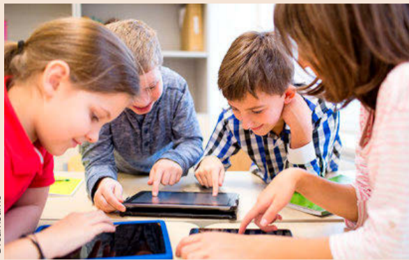
El cuidado de los menores llega a las 'apps' legales.

documentos legales, como requerimientos o contratos, que siempre están disponibles. Sin embargo, lo más innovador es el tipo de servicios que incluye en alguna de estas 'apps'. Por ejemplo, Legálitas Hijos cuenta con un botón del pánico, de forma que un menor con teléfono pueda pulsarlo en caso de tener un